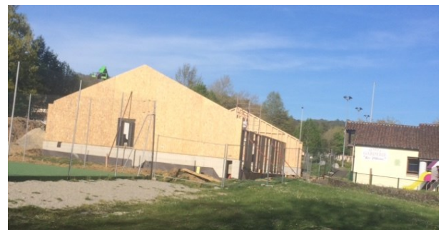
La construction des locaux administratifs du CISVA