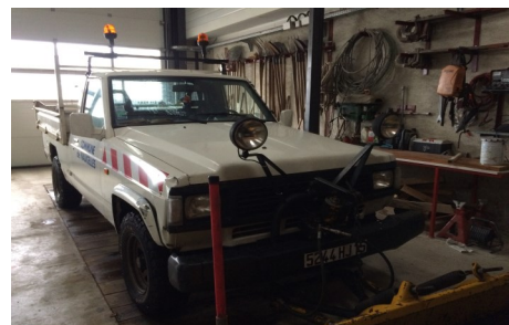
Le 4x4 Nissan